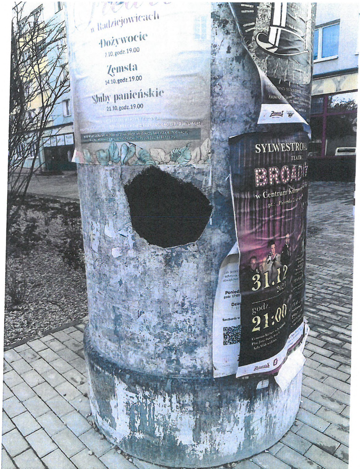
Żyrardów listopada 2023 r.